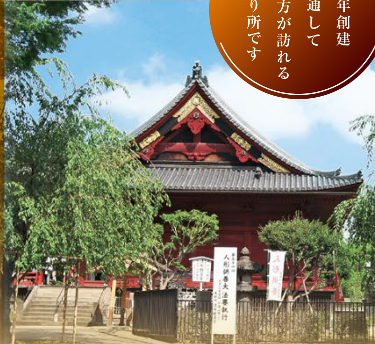
清水観音堂(国指定重要文化財)